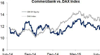
Commerzbank vs. DAX Index